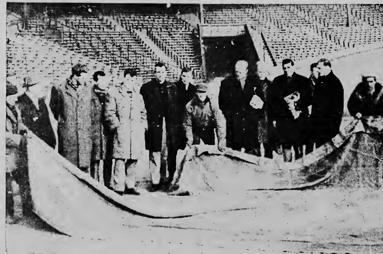
Aki nos ta mira e equipo ganador Feyenoord cu a triunfa riba e equipo Franses Rheims cu e score di 1-0, den e stadion di Paris.

Na Washington e funcionarianan di State Department a anuncia caba, cu nan no por segura e noticia den Washington Star.